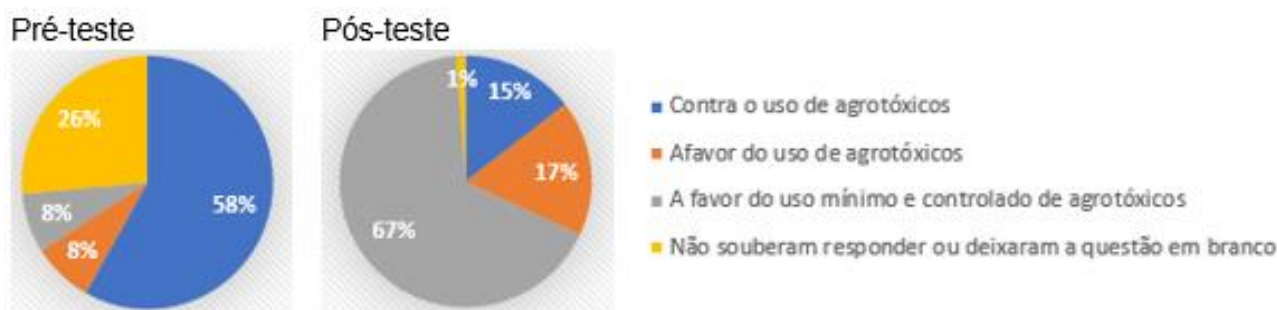
Figura 3- dados das respostas dos alunos no pré-teste e pós-teste da questão 6 do questionário. Fonte: Dados da pesquisa.

Após a leitura de todas as respostas da questão 6, foi possível criar 4 categorias para as respostas dos alunos: contra o uso de agrotóxicos, a favor do uso dos agrotóxicos sem restrição, a favor do uso mínimo e controlado dos agrotóxicos e não souberam responder ou deixaram a questão em branco. O resultado desta análise pode ser observado na Figura 1, onde é apresentada a análise do pré-teste e pós-teste das respostas dos alunos para esta questão.