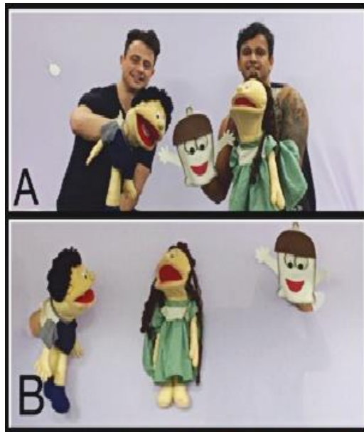
Figura 1. Imagens referentes à apresentação e validação do Roteiro Teatral. A – Os bonecos fantoches e seus manipuladores. B – Os bonecos fantoches no cenário, durante a encenação da peça teatral: As aventuras sexuais de Peniano e Vaginilda .

Peniano e Vaginilda foram confeccionados por costureiras/artesãs de uma área tradicional de comércio tradicional da Vila Rubim, bairro Vitória, município do Estado do Espírito Santo. Preservatrix foi confeccionad@ pelos próprios pesquisadores e para isso se utilizaram de folhas de EVA, pincéis e cola. A figura 1 apresenta os bonecos de fantoches utilizados para interpretação dos personagens descritos acima.