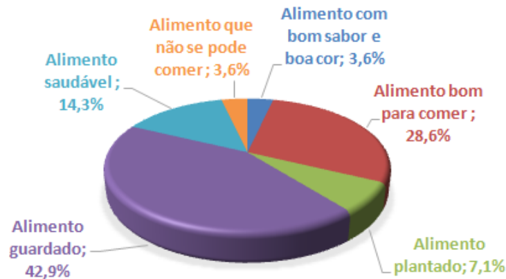
Figura 2. Conceito de conservação de alimentos

No questionário, também foi solicitado que as crianças respondessem à seguinte questão: “O que é um alimento conservado? Explique com suas palavras.”. A Figura 2 representa a frequência relativa de cada padrão de resposta obtido na questão. Neste caso, os dados foram apresentados como frequência relativa, pois por vezes a mesma resposta se enquadrava em mais de uma categoria.