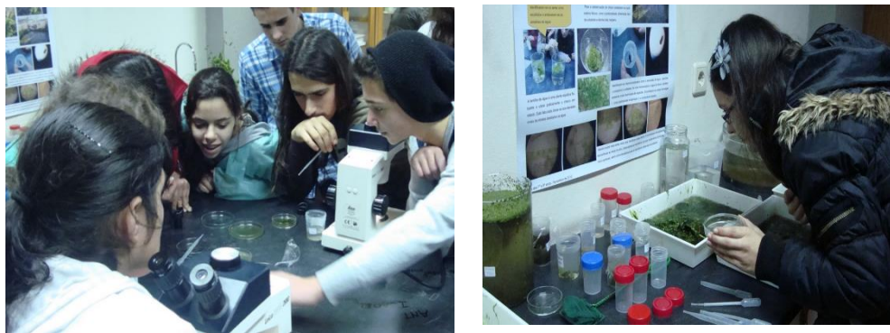
Figuras 11 e 12 - Atividades laboratoriais realizadas por alunos do 11º ano e Clube de Ciências, com investigador da CIBIO - janeiro de 2013.

Para interpretar determinadas características do charco os alunos foram tendo acesso a todos os dados recolhidos até ao momento. Por exemplo, perante o facto da lentilha de água, uma planta aquática flutuante, cobrir praticamente o charco em estudo, os alunos foram confrontados com as análises químicas, de modo a relacionar o fenómeno com os elevados níveis de nitratos detetados na água. Também a variação do nível de água ao longo do ano verificada no charco, associada ao sistema de regadio e à precipitação, foram fatores considerados na discussão acerca de um eventual fenómeno de eutrofização no charco adotado.