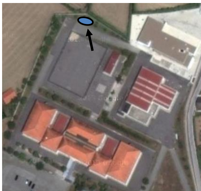
Figura 13 – Localização do charco na EBS de Airões.

Durante a visita do investigador da CIBIO à EBS de Airões foram considerados três locais possíveis para a construção do charco. Destes, o mais viável corresponde ao campo das aveleiras, indicado no mapa que se segue (Figura 13), pela proximidade a outros charcos próximos da escola.