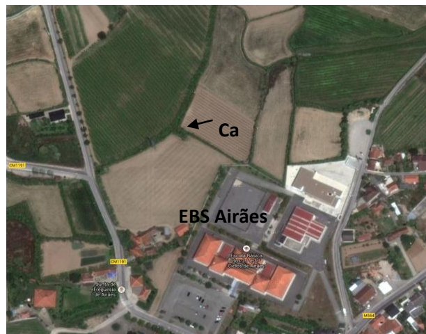
Figuras 2 e 3 - Charco adotado (Ca), num terreno contíguo à EBS de Airões.

Recolheram-se amostras de água, plantas aquáticas e alguns animais. Com redes, fizeram-se arrastamentos para recolha de seres vivos que vivem no fundo dos charcos (Figuras 4 e 5)