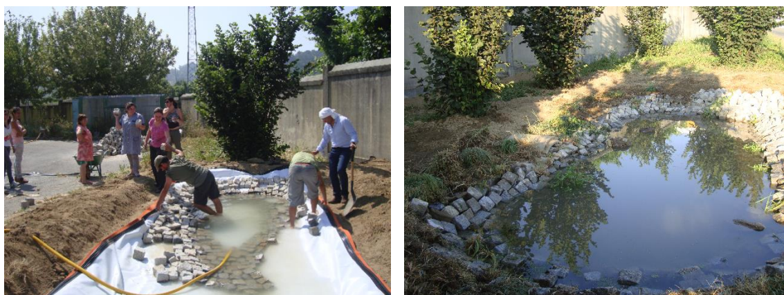
Figuras 14 e 15 - À esquerda charco em construção e à direita acabado de construir.

O charco construído apresenta 2,5 metros de largura e 6 metros de comprimento e uma profundidade máxima de cerca de 70 centímetro. Estabeleceram-se parcerias com os consortes da água e, em particular, com a Junta de Freguesia de Airões. Face à existência de outros charcos nos campos envolvente à escola, existiam condições para uma colonização natural do novo ecossistema. Deste modo procedeu-se à abertura de um canal/furo no muro que delimita o espaço escolar, para criação de uma via de passagem de água e seres vivos. Numa fase inicial imediatamente à construção do charco, houve transporte de água e de algumas plantas e animais do charco adotado para o novo ecossistema. Na construção do charco estiveram presentes dois investigadores do CIBIO-Div, alguns alunos, funcionários e professores que ajudaram na sua execução (Figuras 14 e 15).