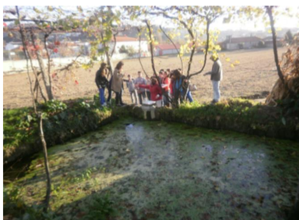
Figuras 6 e 7 – Atividades de campo realizadas por alunos do Clube de Ciências – novembro de 2012.