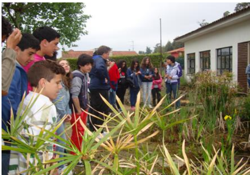
Figura 16 - Visita à Escola Ambiental da Carriça e ao seu charco.

Uma vez que a temática ambiental é transversal ao percurso escolar, a equipa do projeto Ciências Experimentais do 1º CEB também participou nesta atividade. No terceiro período, os alunos do Clube de Ciências visitaram a Escola Ambiental da Carriça, na qual prevalecem práticas de sustentabilidade, entre as quais se inclui a existência de um charco (Figura 16).