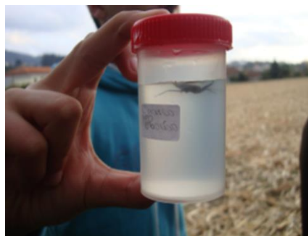
Figuras 4 e 5 - Atividades de campo realizadas por alunos do Clube de Ciências – outubro de 2012.

Para a caracterização do charco “ in situ ” analisaram-se parâmetros físicos, como a profundidade, dimensões, tipo de substrato e declive das margens, bem como parâmetros biológicos como as espécies dominantes nas margens, quer ao nível da flora, quer da fauna (Figuras 6 e 7).