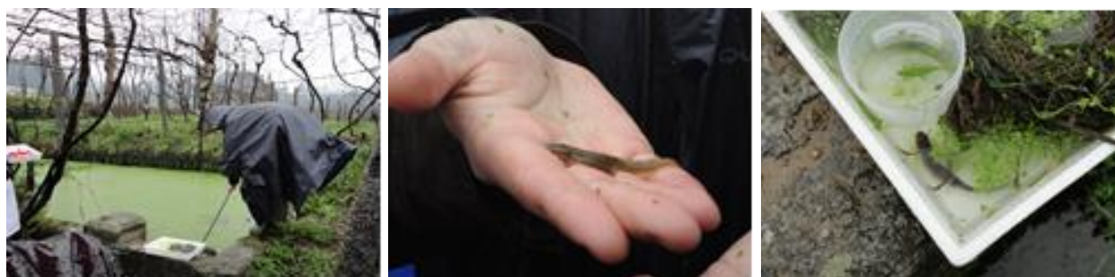
Figuras 8, 9 e 10 - Atividades de campo realizadas por alunos do 11ºano, com investigador da CIBIO - janeiro de 2013.

Ao longo do segundo e terceiro período deu-se continuidade à monitorização do charco adotado: análise biológica, físico e química da água do charco adotado. Uma vez que as condições ambientais não estavam propícias à reprodução de anfíbios e face às procuras infrutíferas de ovos destes organismos não houve possibilidade de realizar o projeto Embriogénese.