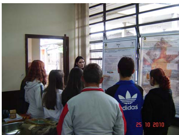
Figura 5 - Apresentação de pôsteres por uma das bolsistas do projeto.

A segunda forma de apresentação se deu na forma de pôsteres, onde cada estudante explicava seu tema em aproximadamente 10 minutos e exemplificando com o experimento construído (quando pertinente) para pequenos grupos de estudantes que faziam rodizio entre os diferentes temas (Fig. 5)