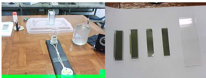
Figura 2 - Experimentos confeccionados sobre o tema Polaróides e Cristais Líquidos .

Neste experimento procura-se comparar a absorção da radiação por parte de corpos com superfícies distintas (uma com superfície preta e outra com superfície branca) e relacionar a taxa de absorção da radiação com a natureza da superfície. Para o tema Polaróides e Cristais Líquidos , procura-se entender o funcionamento de displays de cristais líquidos monocromáticos através do desmonte de LCDs (do inglês Liquid Crystal Display ) de calculadoras e estudar a produção de luz polarizada por: absorção, utilizando-se polaróides presentes em Displays de calculadoras; reflexão, utilizando lâminas de vidro (utilizadas em microscópio), polaróides e uma fonte de luz; dispersão, utilizando como meio dispersor uma emulsão (água e leite) e polaróides (Fig. 2)). Para o tema Laser , foi desenvolvido um experimento no qual é possível demonstrar o fenômeno de difração, determinar o diâmetro de um fio de cabelo e o comprimento de onda de um apontador a laser, utilizando-se telas de serigrafia.