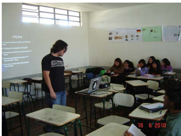
Figura 4 - Apresentação de seminário por um dos bolsistas do projeto.

A segunda forma de apresentação se deu na forma de pôsteres, onde cada estudante explicava seu tema em aproximadamente 10 minutos e exemplificando com o experimento construído (quando pertinente) para pequenos grupos de estudantes que faziam rodizio entre os diferentes temas (Fig. 5)