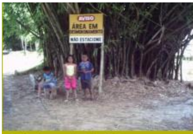
Foto 1: Alunos no local de estudo.

O grupo procurou responder algumas das questões, por meio do planejamento e desenvolvimento de algumas atividades que pudessem servir de auxílio para as respostas às dúvidas apresentadas pelas crianças, como foi o caso do significado da palavra desmoronamento.