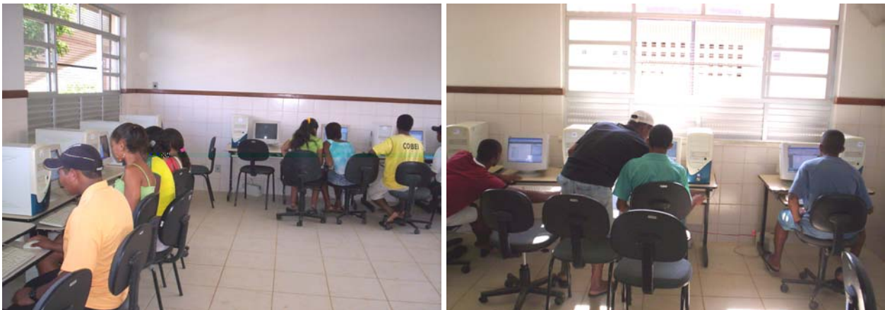
Figura 1. Dois momentos da participação dos alunos no mini-curso.

Os resultados e as análises dos discursos ocorreram ao longo de todo processo nas duas turmas, buscando-se analisar criticamente o enunciado 1 em seu contexto e privilegiando a íntegra do processo de intervenção realizado. Procurou-se, dessa forma, lidar com significados, motivações, atitudes e valores inseridos num enfoque de relações, processos e fenômenos, sem destoar da realidade que não pode ser quantificada, mas que tem significado e intencionalidade (Minayo, 2000).